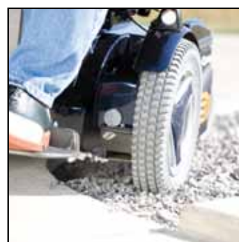
C400 har ESP (Enhanced steering performance) som standard. Systemet korrigerer automatisk retningen på rullestolen ved ujevnt underlag og i høyere hastigheter.