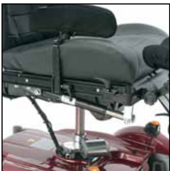
UniTrack tilbehørssystem. Du velger deler til en komplett støtte som passer til deg. Enkel løsning med skinne, ledd og hurtigfester gjør at du kan endre lengde og vinkel raskt.