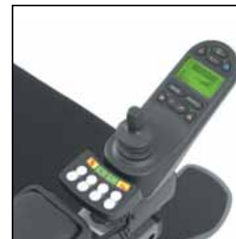
R-net elektronikk med ICS. Du kan bruke alle el.funksjoner, alternative styresystemer og har dessuten mulighet for å lagre favorittposisjoner.