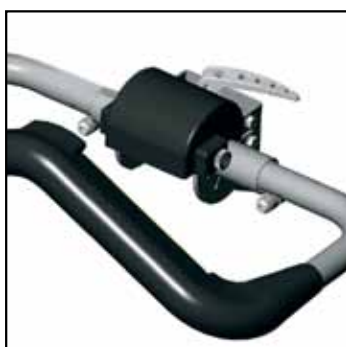
CoPilot, en ledsagerstyring som er enkel å bruke.