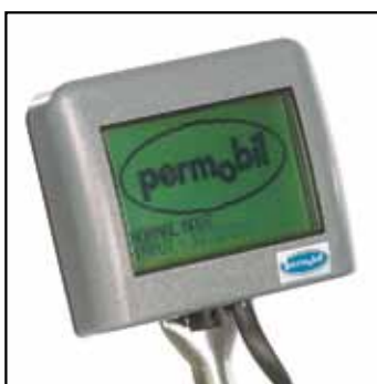
DriveLink gir deg flere muligheter. Du kan bruke alternative betjeninger, omgivelseskontroll etc.