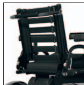
Rygpolster med stropper der kan justeres, giver en god støtte til ryggen.