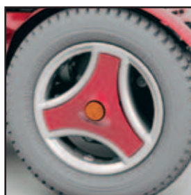
Delbare fælge i samme farve som chassis.