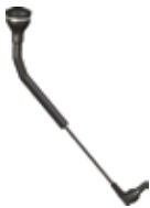
SCHALTER AUF SCHWANENHALS