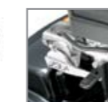
Elektrische oder manuelle Sitzschwenkung um 180°.