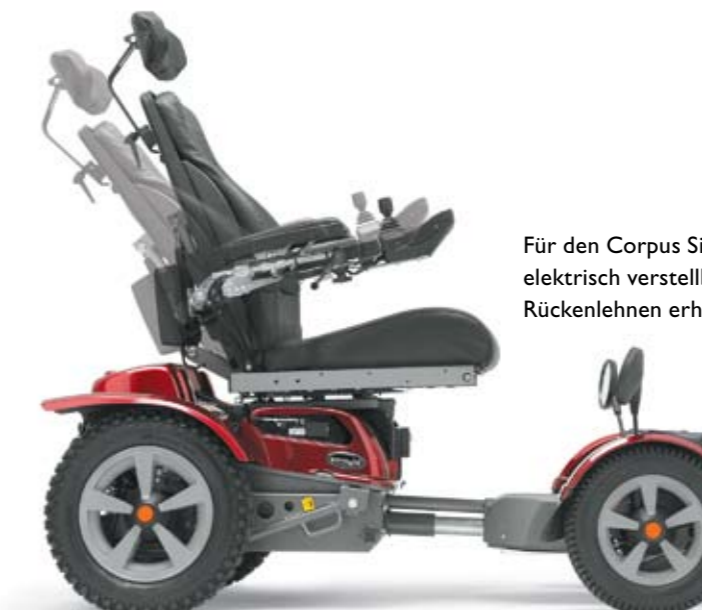
Für den Corpus Sitz sind elektrisch verstellbare Rückenlehnen erhältlich.