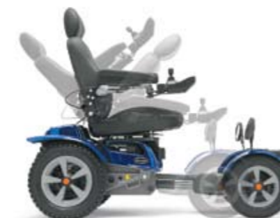
Manuell verstellbare Rückenlehne