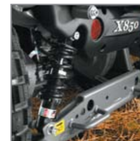
Individuelle, robuste Federung