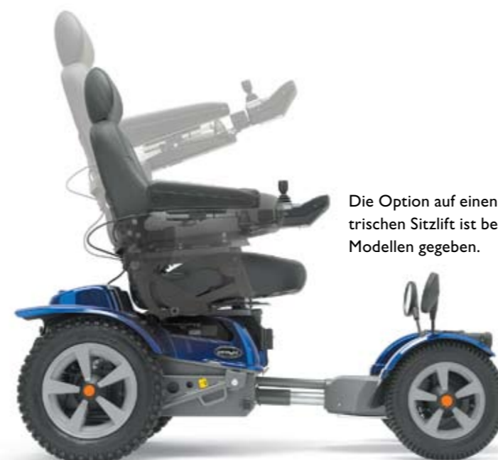
Die Option auf einen elektrischen Sitzlift ist bei allen Modellen gegeben.