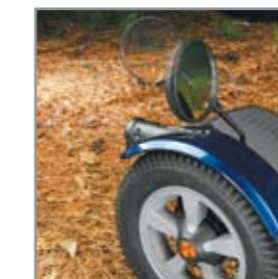
Gefederte Spiegel, die nicht an Hindernissen hängen bleiben.