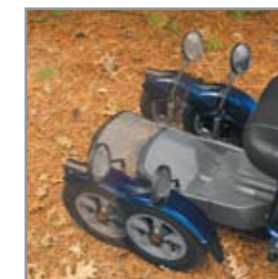
Einstellbare Achsabstand, der spezifisch auf die für Sie passende Rollstuhllänge angepasst wird