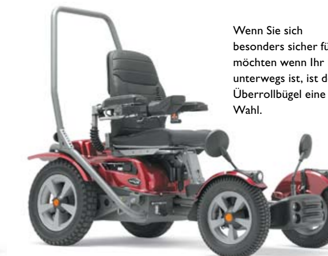
Wenn Sie sich besonders sicher fühlen möchten wenn Ihr Kind unterwegs ist, ist der Überrollbügel eine gute Wahl.