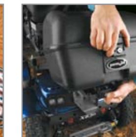
Leicht abzunehmender Gepäckkoffer