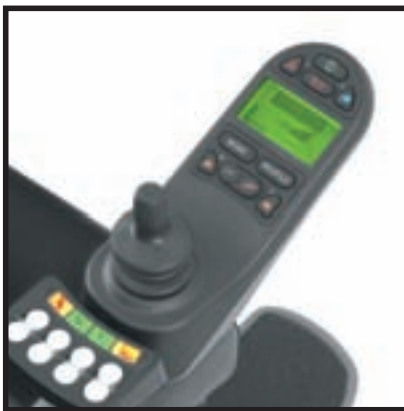
R-Net-elektronica met ICS