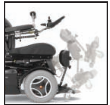
Elektrische beensteunverstellingen werken onafhankelijk van de elektrische rugverstelling