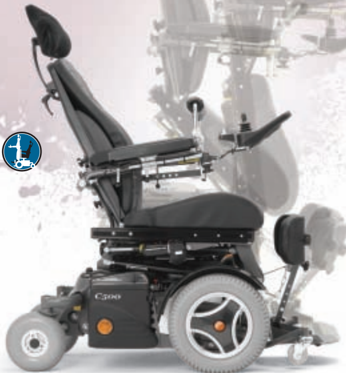
Elektrisch verstelbare zitting om uit elke positie op te staan. Optioneel: rijden op een lagere snelheid in de sta-stand.