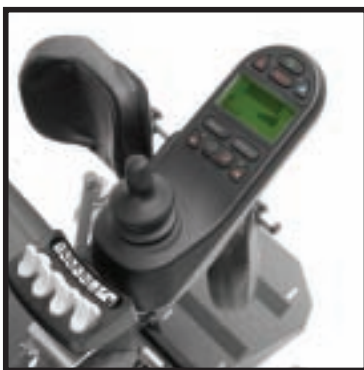
R-Net-elektronica met ICS voor geavanceerde programmeerbaarheid.