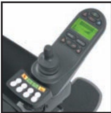
R-Net-elektronica met ICS