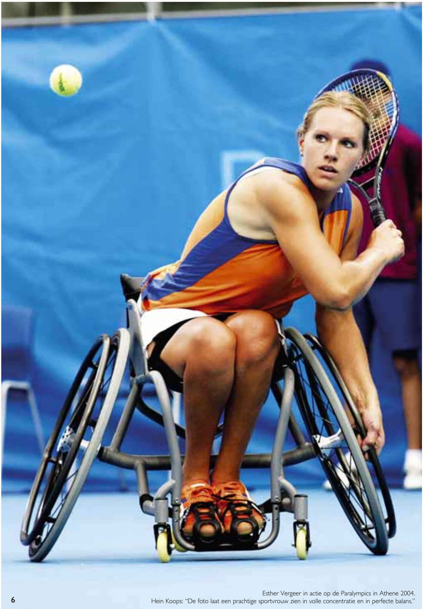
Esther Vergeer in actie op de Paralympics in Athene 2004.

Hein Koops: "De foto laat een prachtige sportvrouw zien in volle concentratie en in perfecte balans."