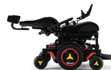
Hoek rugleuning – verstelbaar