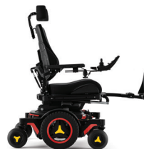
Hoek beensteun – verstelbaar