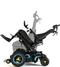
Neigungswinkel verstellbar (nach hinten)