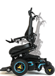
Neigungswinkel verstellbar (nach vorne)