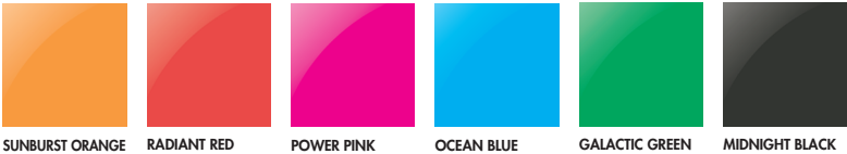
SUNBURST ORANGE RADIANT RED POWER PINK OCEAN BLUE GALACTIC GREEN MIDNIGHT BLACK