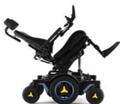
Neigungswinkel verstellbar (nach hinten)