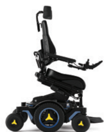
Neigungswinkel verstellbar (nach vorne)