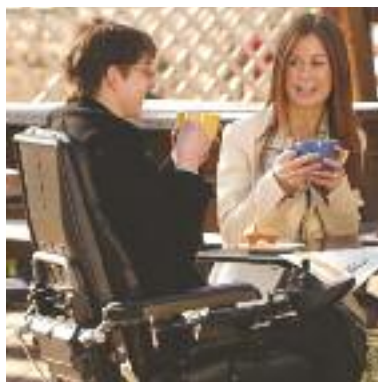
Als het leven een combinatie van binnen en buiten is, is de C400/C500 een comfortabele en praktische oplossing.

dividueel te kunnen aanpassen en veranderen is met name van belang bij mensen met een progressief ziektebeeld. Dankzij het unieke aanpassingsvermogen van onze rolstoelen, kunnen wij onze gebruikers gedurende een lange periode van dienst zijn. Om bovengenoemde groep hun onafhankelijkheid en mobiliteit te laten behouden, komt Permobil met het Just You pakket. Het pakket bestaat uit een compleet uitgeruste rolstoel naar keuze, die snel geleverd wordt en op maat gemaakt is volgens de wensen en eisen van de gebruiker. Daarnaast